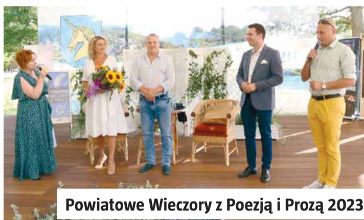
Powiatowe Wieczory z Poezją i Prozą 2023

Studenci UTW prezentują swoje sekcje oraz to co wydarzyło się u nich w ostatnim miesiącu.