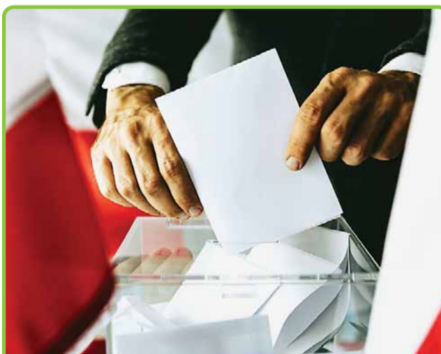
WYBORY 2023. SPRAWDŹ GDZIE GŁOSUJESZ STRONA 15