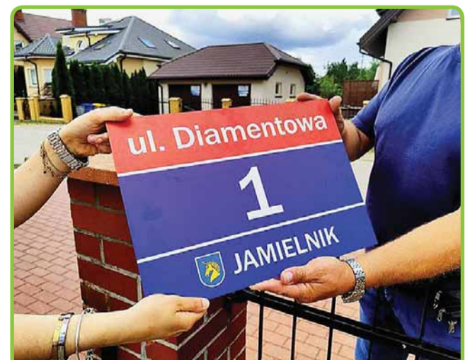
PIERWSZE TABLICZKI W JAMIELNIKU ZAMONTOWANE STRONA 4