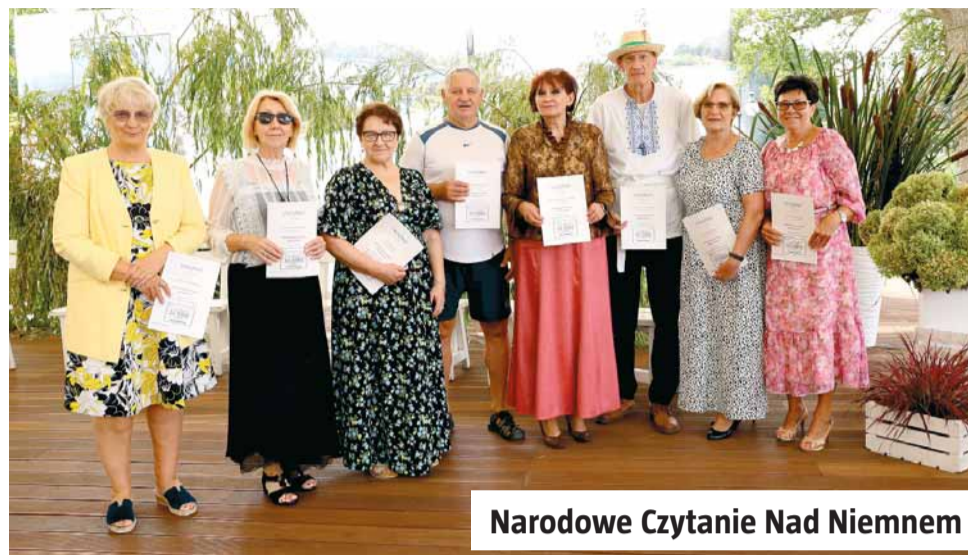
Narodowe Czytanie Nad Niemnem