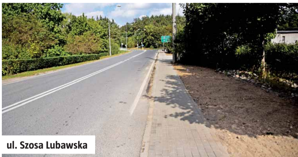
ul. Szosa Lubawska

W ostatnim czasie na ul. Piaski i ul. Szosa Lubawska powstały nowe chodniki łączące ulice z obwodnicą. Dzięki temu utworzone zostało bezpieczne połączenie centrum miasta z jego obrzeżami - zarówno piesze jak i rowerowe. To odpowiedź na liczne zapytania mieszkańców, którzy dojeżdżają tamtędy do pracy, ale także do pobliskiego przytuliska, gdzie wolontariusze opiekują się lidzbarskimi bezdomniakami.