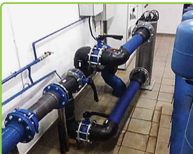
NOWOCZESNE LAMPY UV ZAMONTOWANE STRONA 5