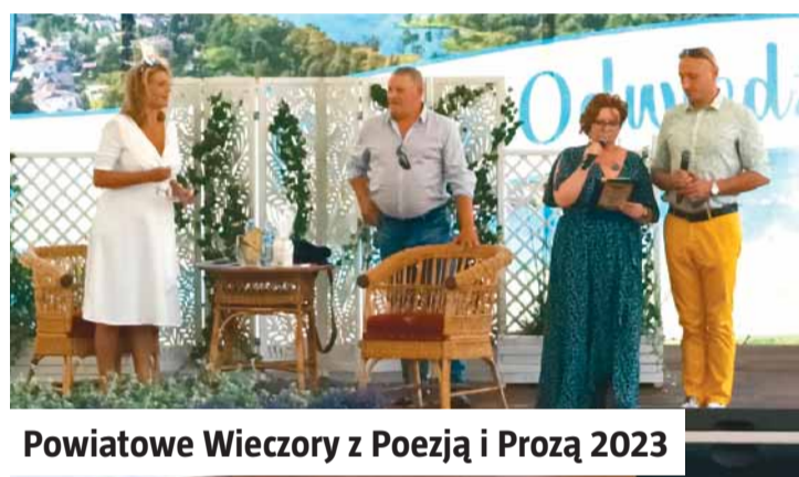
Powiatowe Wieczory z Poezją i Prozą 2023