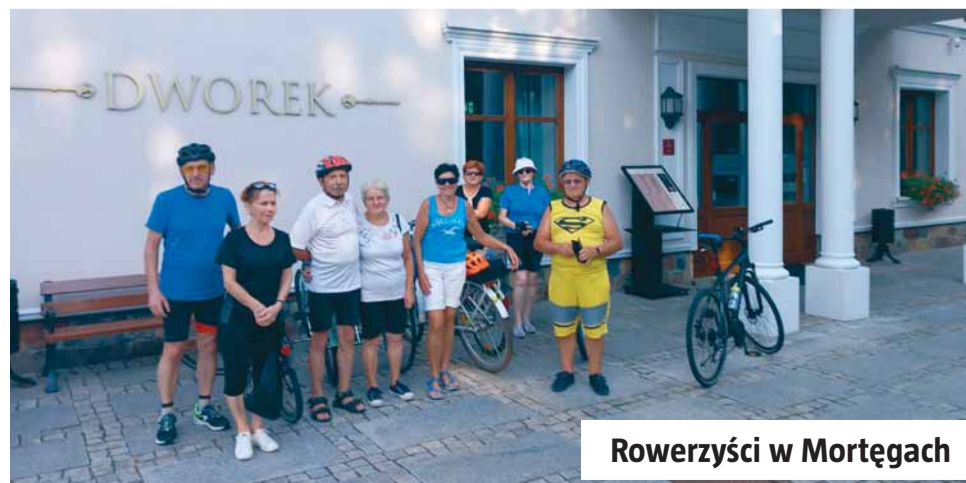
Rowerzyści w Mortągach